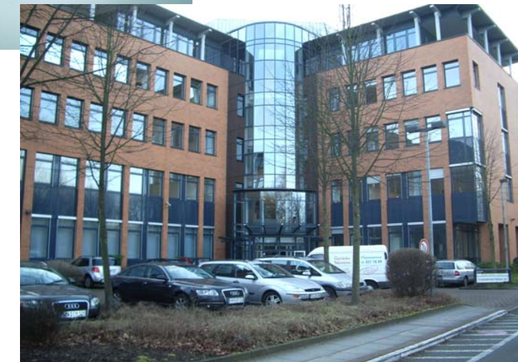
Airport-Center Flughafenstraße 52