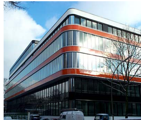
Bürogebäude Humboldt Straße in Hamburg

Bauherr: Humboldt Campus GmbH & Co.KG c/o Quantum Immobilien AG Architekt: BRT Architekten Fertigstellung: 2004 Leistungen: H, RLT, S, E, BS