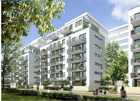
Wohnen am Lohmühlenpark, Steindamm 96 -106 in Hamburg

Bauherr: HBE Hamburgische Baulandentwicklungsgesellschaft mbH c/o Quantum Immobilien AG Architekt: Leusmann Planungsgesellschaft Fertigstellung: 2010 Leistungen: H, RLT, K, MSR, S, E, SÜLA, BS