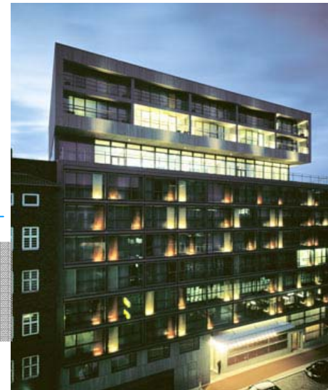
Side Hotel Hamburg

Bauherr: Garbe Development GmbH Architekt: Meurer Architekten + Stadtplaner BDA Fertigstellung: 2008 Leistungen: Brandschutz