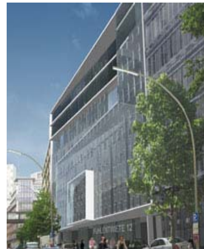
Bürogebäude Fuhrentwiete Hamburg

Bauherr: ESC Treuhandgesellschaft mbH Architekt: nhm Architekten Fertigstellung: 2006 Leistungen: H, RLT, S, E, MSR, K