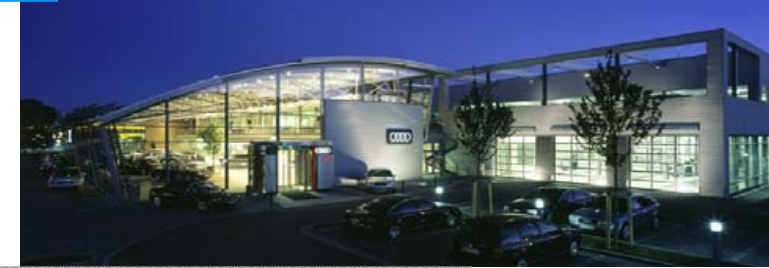
AUDI Zentrum Hamburg

Bauherr: Audi AG Architekt: Koller Heitmann Schütz Architekten BDA Fertigstellung: 2006 Leistungen: H, RLT, S, E, K