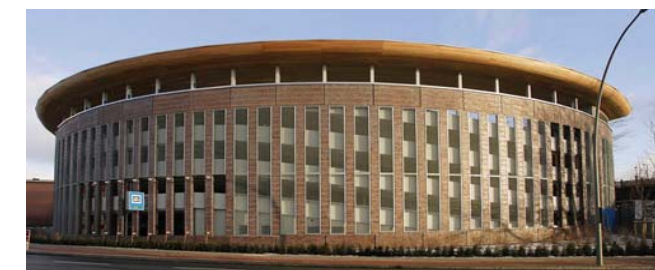
Parkhaus Hamburg Bergedorf

Bauherr: Seaside Hotel Hamburg GmbH & CO.KG Architekt: Alsop & Störmer Fertigstellung: 2001 Leistungen: H, RLT, K, MSR, S, E, SBT