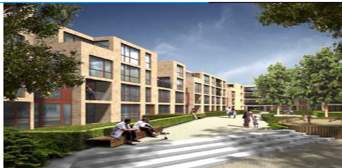
Mehrfamilienwohnanlage Poppenbütteler Berg in Hamburg

Bauherr: BDS Baugenossenschaft Dennerstraße-Selbsthilfe eG Architekt: KBNK Architekten Fertigstellung: 2010 Leistungen: H, RLT, S, E