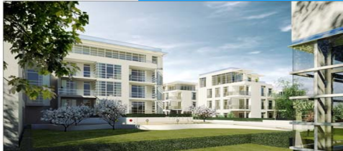
Harvestehuder Weg 36 / Alsterkamp 43 in Hamburg

Bauherr: apv Alsterproperty GmbH & Co.KG c/o Vivacon AG Architekt: Czerner Götsch Architekten GmbH Fertigstellung: 2010 Leistungen: H, RLT, S, E, FÖ, MSR, K, BS